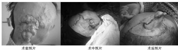
图 1 典型病例 1 右耳郭、颞部血管瘤